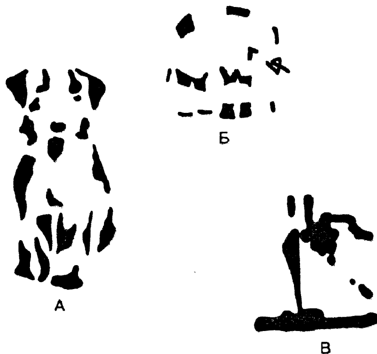
Рисунок 5.1. Неполные изображения

Другим важным фактором, влияющим на восприятие, является недавний опыт, связанный с объектом восприятия. По данным Стейнфелда, испытуемые, которым была рассказана история об океанском круизе, узнали на рисунке 5.1. в паролод менее чем за 5 секунд. У тех же, кому предлагался рассказ на другую тему, на это уходило 30 секунд. Мы предполагаем, что текущие события будут похожи на то, что было недавно.